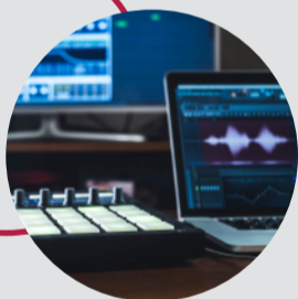
Musik & Computer