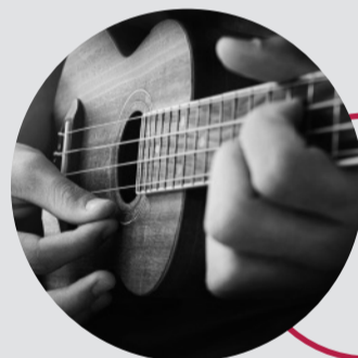
Einzelunterricht / Ensembles

Mental fit auf die Bühne, Volksmusik, Improvisation, Theorie, Atem & Körper, Musikgeschichte